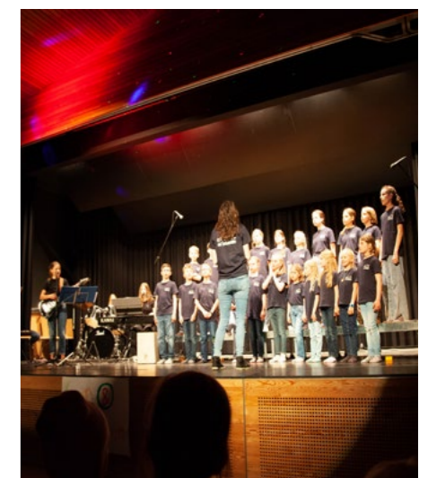
La Bargeda im Frühling 2023

Dieser Anlass wird für alle Teilnehmenden eine grosse Herausforderung doch auch ein unvergessliches Erlebnis sein.